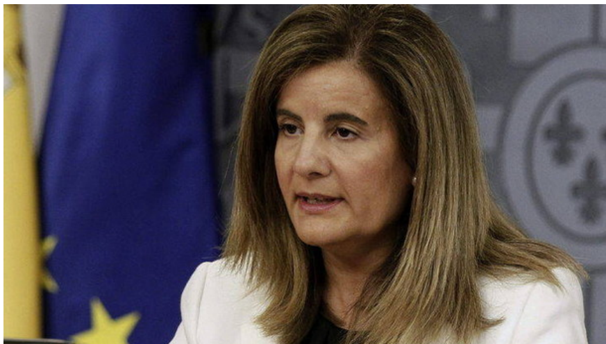
La ministra de Empleo, Fátima Báñez.

El Gobierno ha acordado con los sindicatos modificar el criterio en relación con el acceso a la jubilación anticipada, por lo que aquellas personas que perdieron su trabajo antes del 1 de abril de 2013 sin formar parte de un despido colectivo y manteniendo convenios individuales con la Seguridad Social podrán